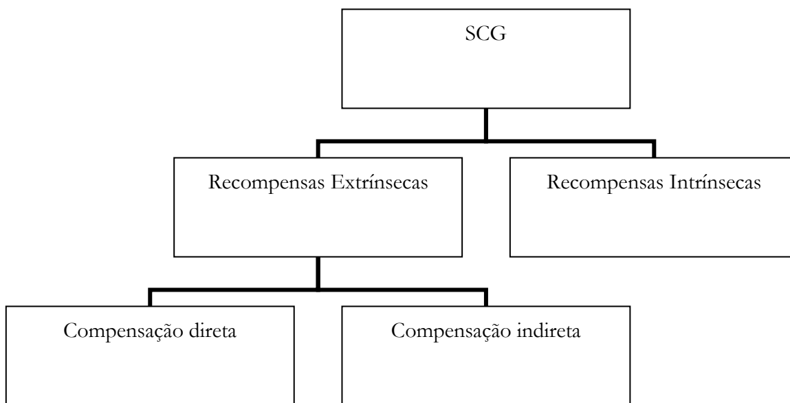
Figura 2: Sistema de Compensação Global

Por outro lado, Peretti (2007) lembra que uma boa gestão dos expatriados será facilitada com o Sistema de Compensação Global (SCG) apresentado na Figura 2 .